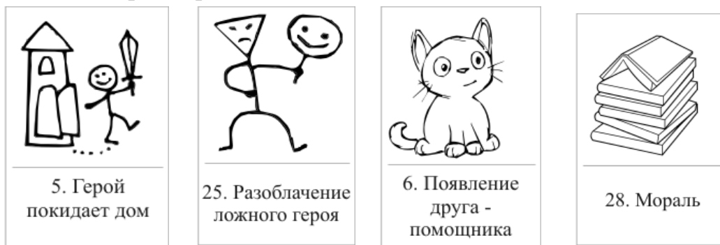
Рис. 1 «Карты Проппа»

Для начала подготовила карточки Проппа, и провела с педагогами мастер – класс «Карты Проппа - новый приём в работе со старшими дошкольниками по развитию речи».